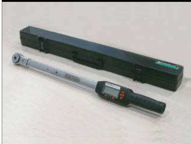
● 扭力扳手 95978172 (AV 8172) (更换扭力扳手 USAG 815F)