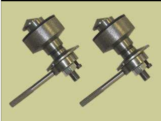
● 安全固定器 95978183 (AV 8183) 车辆防倾翻固定。