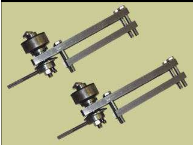
● 安全固定器的紧固支架 95978184 (AV 8184) 跑板式举升机中已举升车辆的防倾翻固定。