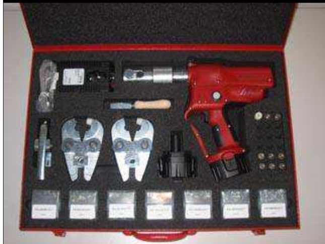
● 铆接机蓄电池工具 95978173 (AV 8173) (参见铝制车身外壳的维修手册)。